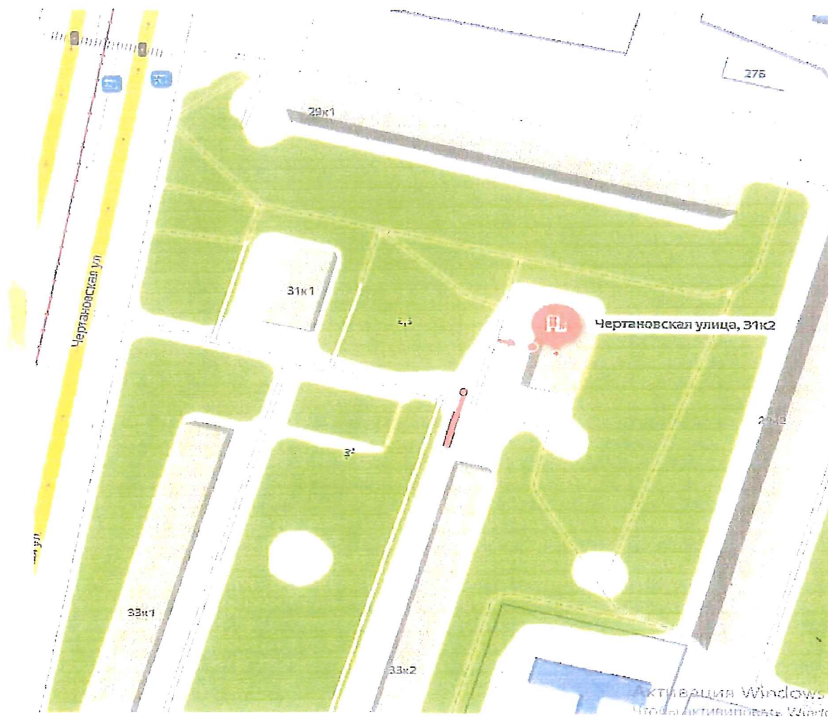
Схема установки ограждающего устройства (место размещения, тип, размер, внешний вид ограждающего устройства)

Приложение к решению Совета депутатов муниципального округа Чертаново Центральное от 14 декабря 2022 года № 01-03-109